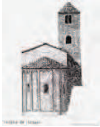
Reconstrucción ideal del templo románico de Sant Pere de Riu (1992)

ta C-32 y la depuradora de aguas residuales del Alt Maresme Nord 5 . El sendero no pierde la traza y penetramos en una zona más montañosa y boscosa presidida por la iglesia parroquial de Sant Pere de Riu 6 , de origen románico.