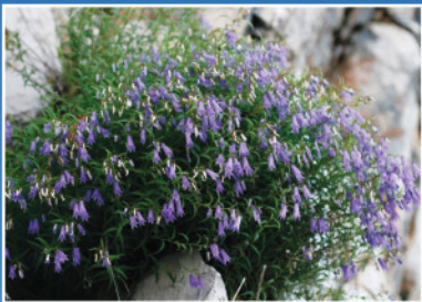
Učkarski zvončić Učka's bellflower Campanula del Monte Maggiore Die Glockenblume von Učka [ Campanula tommasiniana ]

... Durante i mesi estivi dalla torretta sul Vojak si possono osservare i grifoni ( Gyps fulvus ) e le aquile reali ( Aquila chrysaetos ) mentre sorvolano la cima?