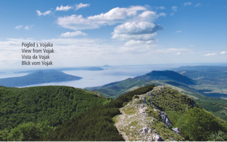
Pogled s Vojaka View from Vojak Vista da Vojak Blick vom Vojak