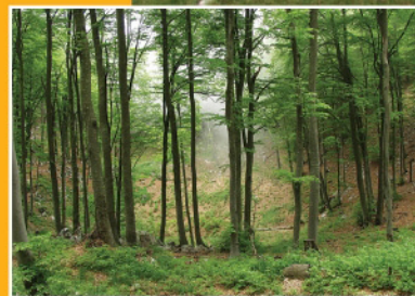
Bukova šuma - Beech forest Bosco di faggio Buchenwald