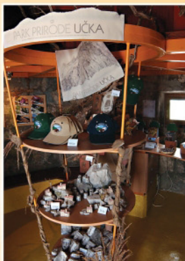
Suvenirnica u kuli Souvenir shop in the Vojak tower Negozio di souvenir nella torretta Souvenirladen im Aussichtsturm