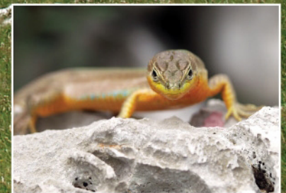
Kriska gušterica Dalmatian Wall Lizard Lucertola adriatica Adriatische Mauereidechse [lacerta podarcs melisellensis]